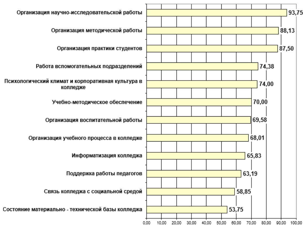
Диаграмма Преподаватели. Уровень удовлетворенности по основным группам показателей (%)

Мониторинг удовлетворенности участников образовательного процесса. 2021-2022 уч. г. Специальность 54.02.06 Изобразительное искусство и черчение