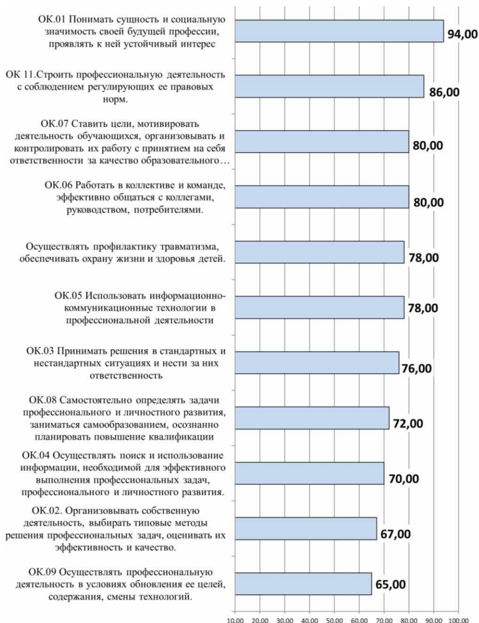
Диаграмма Работодатели. Оценка уровня сформированности общих компетенций студентов