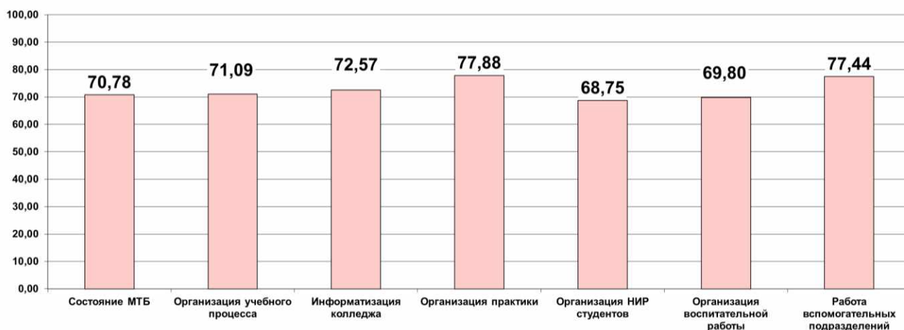
Диаграмма Студенты. Уровень удовлетворенности по основным группам показателей (%)

Мониторинг удовлетворенности участников образовательного процесса. 2021-2022 уч. г. Специальность 54.02.01 Дизайн (по отраслям)