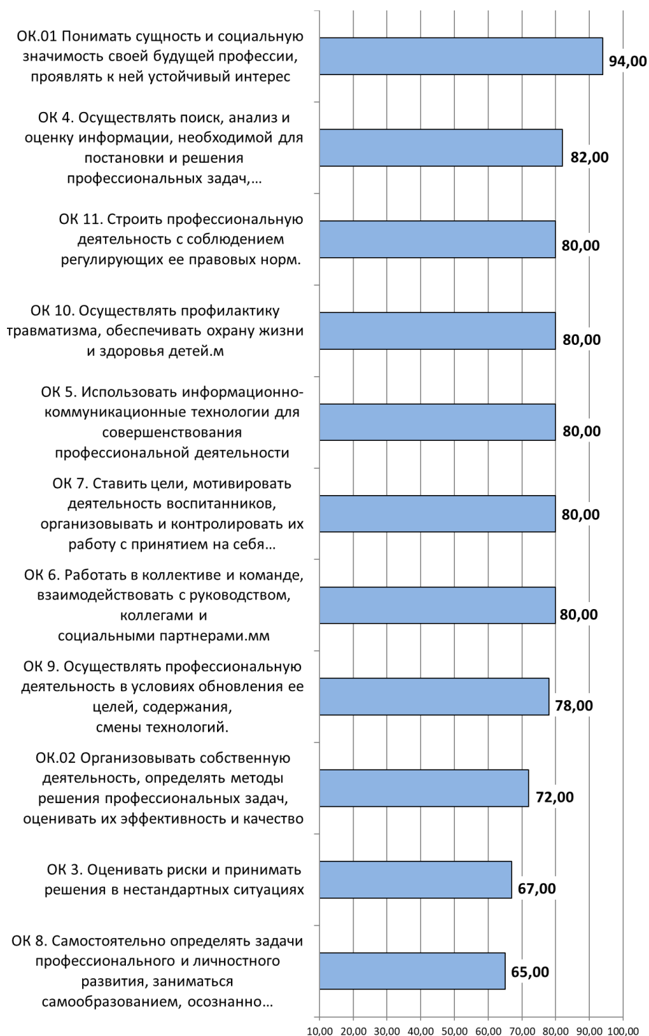
Диаграмма Работодатели. Оценка уровня сформированности общих компетенций студентов