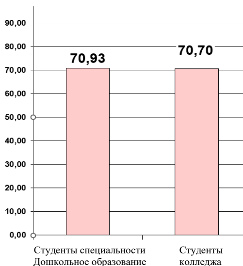
Диаграмма Студенты. Общий уровень удовлетворенности (%)