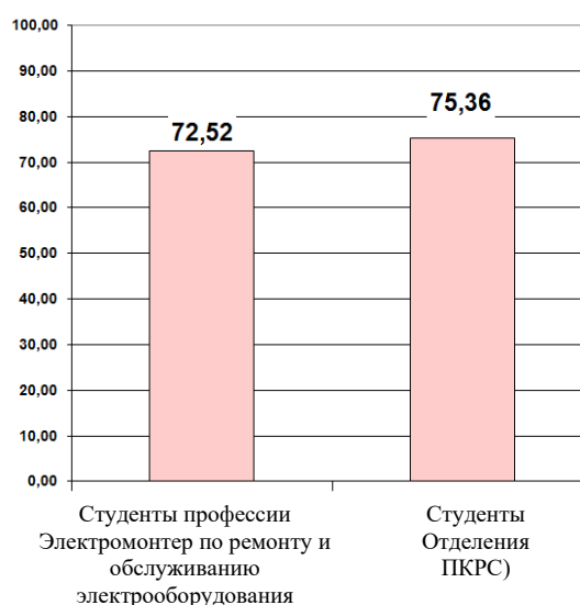
Диаграмма Студенты. Общий уровень удовлетворенности (%)

Мониторинг удовлетворенности участников образовательного процесса. 2021-2022 уч. г. Профессия 13.01.10 Электромонтер по ремонту и обслуживанию электрооборудования (по отраслям). Ул. Сысольская, 12