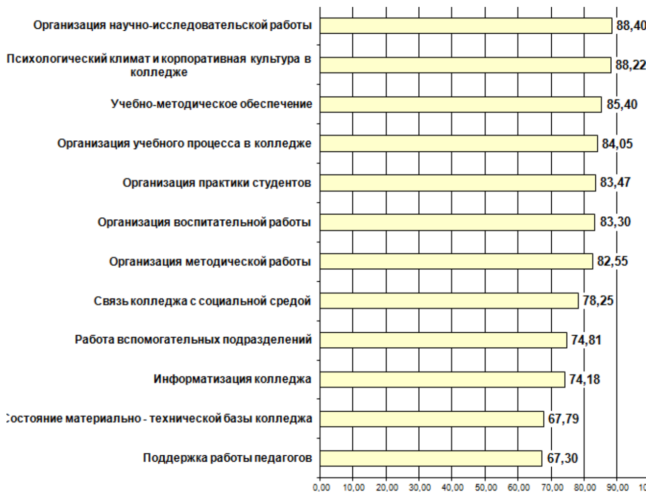
Диаграмма Преподаватели. Уровень удовлетворенности по основным группам показателей (%)