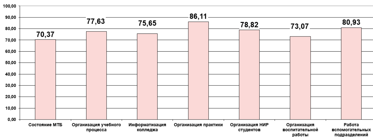
Диаграмма Студенты. Уровень удовлетворенности по основным группам показателей (%)

Мониторинг удовлетворенности участников образовательного процесса. 2021-2022 уч. г. Профессия 13.01.10 Электромонтер по ремонту и обслуживанию электрооборудования (по отраслям). Ул. Пушкина, 107-А