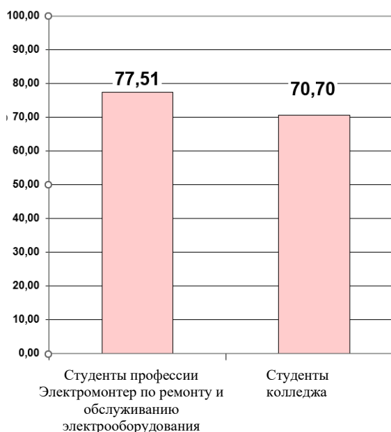
Диаграмма Студенты. Общий уровень удовлетворенности (%)

Мониторинг удовлетворенности участников образовательного процесса. 2021-2022 уч. г. Профессия 13.01.10 Электромонтер по ремонту и обслуживанию электрооборудования (по отраслям). Ул. Пушкина, 107-А