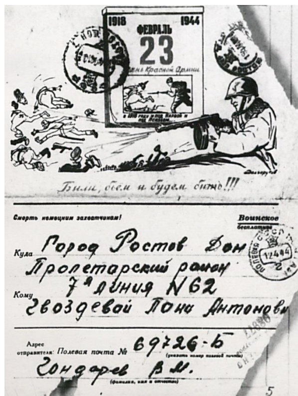
Письмо с фронта Василия Гондарева, погибшего 28 апреля 1944г. под Севастополем