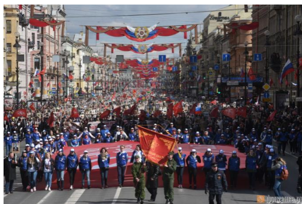
"Бессмертный полк" в Санкт-Петербурге

Для того чтобы раскрылся неисчерпаемый потенциал Бессмертного полка, 30 сентября 2015 года был зарегистрирован "Бессмертный полк России" - общероссийское общественное гражданско-патриотическое движение. За его создание высказались представители шести десятков регионов России, собравшиеся 2 июня 2015 года на съезде в городе воинской славы Вязьме Смоленской области.