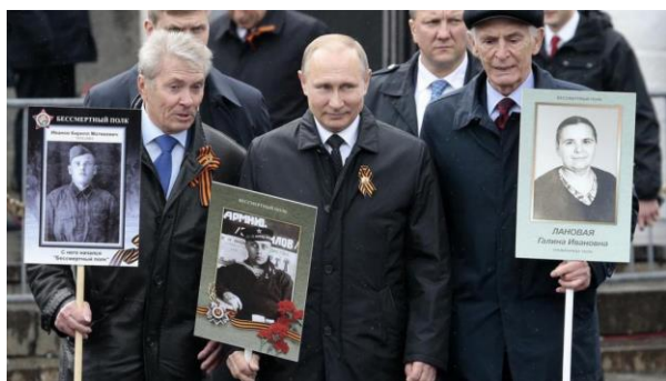
В.В. Путин с портретом своего отца-фронтовика

Через 2 года такие парады прошли более чем в 20 регионах нашей страны. В Москве в 2010 и 2011 на Поклонной горе провели акцию "Герои Победы - наши прадеды, деды!", на которую вышли с портретами своих дедов и прадедов московские школьники вместе с родителями. В 2012 году в Томске тоже прошли с портретами солдат. Тогда-то акция и получила свое нынешнее название "Бессмертный полк".